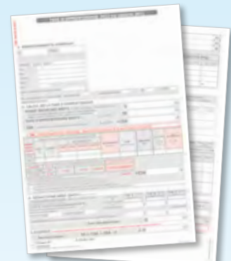
Bordereau ≥ à 250 salariés

En 2011, près de 13 000 entreprises des Pays de la Loire ont fait confiance à leur CCI pour traiter leur taxe d'apprentissage. Elles ont ainsi bénéficié d'un accompagnement personnalisé et d'une expertise avérée. La taxe d'apprentissage contribue à investir sur les hommes, leurs qualifications, la formation étant un des leviers majeurs de la compétitivité régionale.