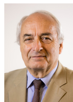
Pierre Goguet Président de CCI France

Ces dispositifs et initiatives permettent aux entreprises industrielles de progresser, d'accéder à de nouveaux marchés. Ainsi, à l'instar de la politique menée en faveur de la revitalisation des centre-villes, le réseau des CCI reste plus que jamais acteur des territoires d'industrie de demain.